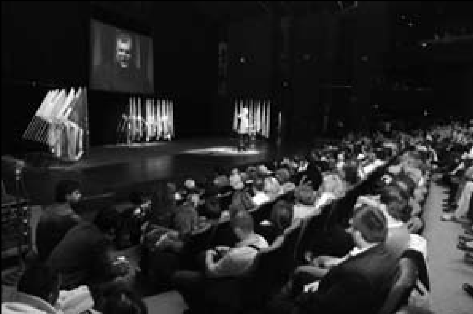
Končar: Nacionalizam dao legitimitet ukidanju autonomije