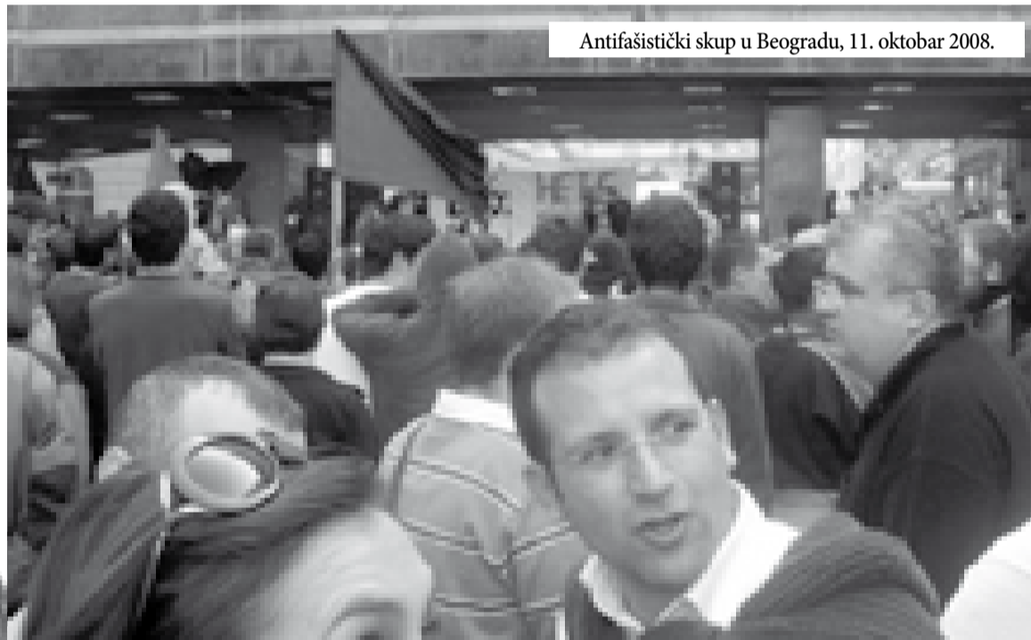
Antifašistički skup u Beogradu, 11. oktobar 2008.

Najava republičkog tužilaštva kako će zabraniti »Nacionalni Stroj« jeste vrhunac licemerja. Jer je osuđenom nacisti Goranu Davidoviću dopušteno ne samo da ima pasoš, već i da ga koristi. Pre dva meseca ovaj neonacista koji je osuđen na godinu dana zatvora, emigrirao je u Italiju. Kako onda verovati državnim organima Srbije da su ozbiljni u svojoj nameri? Republičko tužilaštvo neće da vidi da zabranom jedne organizacije ne može biti rešen problem neonacizma i fašizma u Srbiji. Njeni pripadnici će ili radikalizovati svoje akcije i početi da ubijaju, ili preći u neku drugu organizaciju. Zabranom samo Nacionalnog stroja odobrava se postojanje ostalih organizacija ( Krv i Čast, Obraz, 1389, Naši Nomokanon, Dveri srpske) Dokle god se u udžbenicima istorije bude govorilo o četnicima kao antifašistima, o Ljotiću i Nediću kao velikim rodoljubima, o Nikolaju Velimiroviću kao najvećem Srbinu posle svetog Save, u Srbiji će rasti neonacizam.